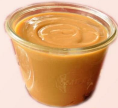
DELICIOSO DULCE DE LECHE CREMOSO EN VASO