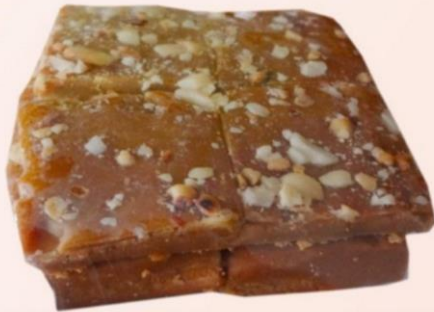
DULCE DE LECHE CON MANÍ EN CUADRITOS