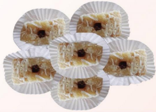
COQUITO CUADRITO DECORADO CON PASAS ↑