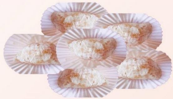
EMPANADAS RELLENAS DE COCO Y AZÚCAR PULVERIZADA ↑