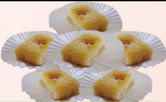
COMBINADO DE MANJAR CON BOCADILLO ↑