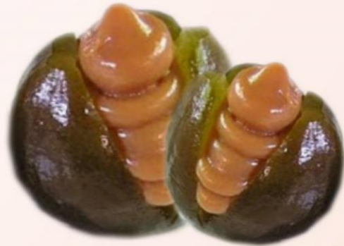
DELICIOSAS BREVAS RELLENAS DE AREQUIPE