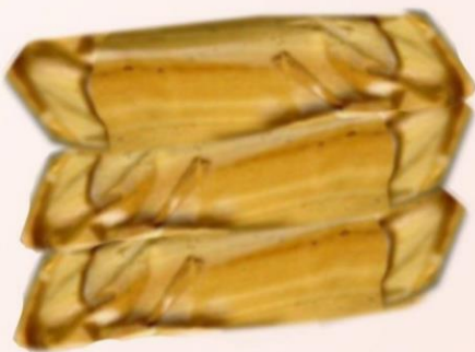
DELICIOSA MELCOCHA EN BARRA