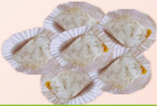
CUADRITO DE MANJAR CON AZÚCAR PULVERIZADA ↑