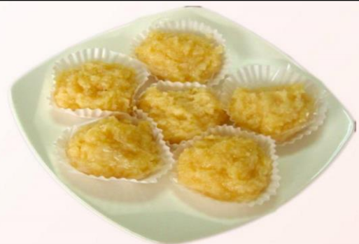
DELICIOSAS COCADAS ↑