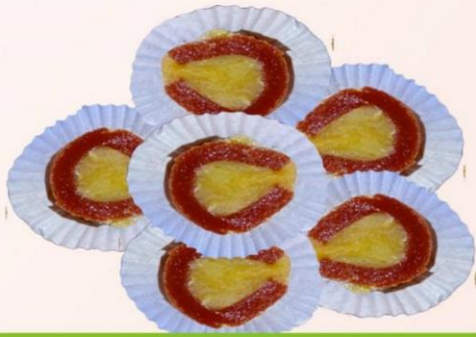
LEÑADOR RELLENO CON BOCADILLO