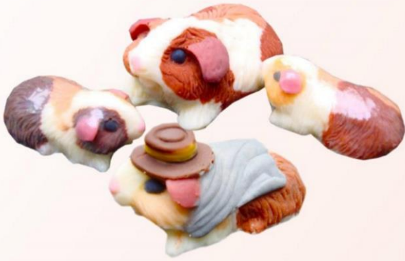
DELICIOSOS CUYES DE CHOCOLATE ↑